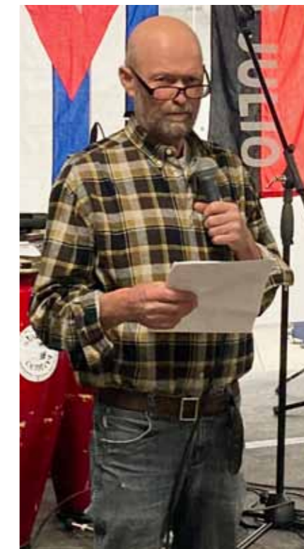
»Jeg vil opfordre DCF's hovedbestyrelse til – gerne sammen med andre venskabsforeninger og miljøbevægelser – at vi øger indsatsen for støtte til solceller og batterier i Cuba«, lød det fra taleren.

I trafikken kører busser og hestevogne og cykler og biler rundt i en syndig forvirring – men man ser ikke folk råbe eller true af