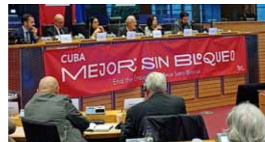
I november var foreningens formand med til det internationale tribunal i Bruxelles om USA's blokade mod Cuba.

fortsat skal kontaktes med et brev til deres bopæl.