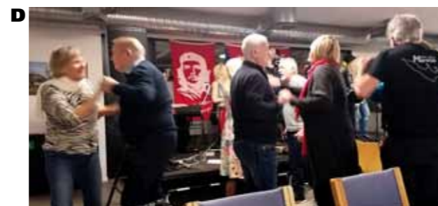
A: Fiesta Cubana – det var lørdag den 3. februar hos fagforeningen 3F BJMF i Valby.