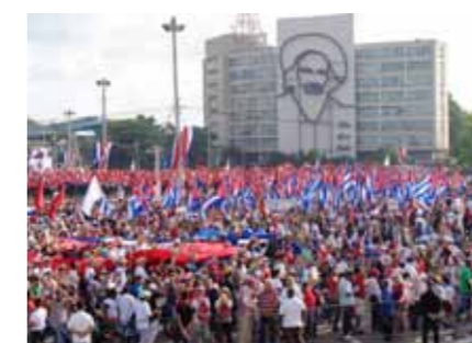
Fra 1. maj på Revolutionspladsen i Havanna.

På hjemmesiden kan du også hente oplysninger om senere solidaritetsbrigader til sommer og den kommende vinter.