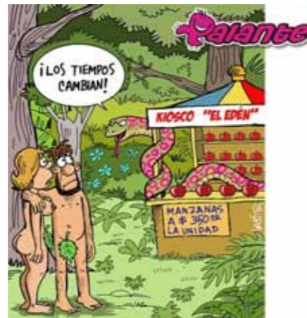
Ungdomsbladet Pa'lante i Cuba har bragt en satirisk forside om de hårde tider »i Paradiset«, hvor inflationen har fået priserne til at eksplodere.

I juni skrev foreningen et åbent brev til Joe Biden, hvor vi bad ham om at fjerne Cuba fra USA's terrorliste. På det tidspunkt fungerede Cuba sammen med Norge som fredsmæglere i forhandlinger i Havanna mellem Colombias præsident Gustavo Petro og ELN