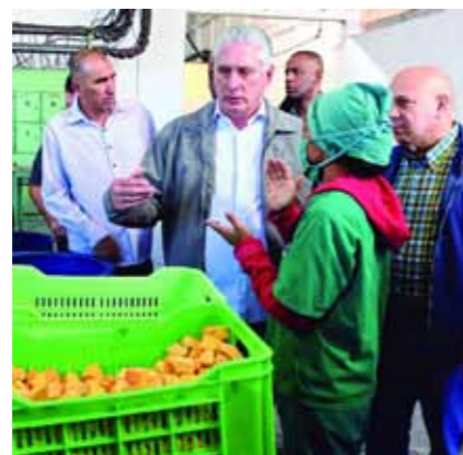
Cubas præsident Miguel Diaz-Canel engagerer sig i kampagner for at øge produktionen. Her besøg på et ananaslandbrug.

Emigrationen skaber stor efterspørgsel efter udenlandsk valuta i Cuba, så man har en startkapital i det land, man emigrerer til. De statslige cubanske banker kan på ingen måder imødekomme denne efterspørgsel pga. USA's sanktioner samt manglende indtægter fra udenrigshandel efter pandemien, faldende markedspriser på råvarer