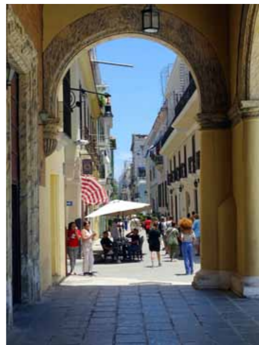
Dansk-Cubansk-Forening giver medlemmer og andre interesserede et kig ind i Cuba med Cubabladet, nyhedsbrev, Facebook, Instagram og andre sociale medier.

Siden 1992 har Cuba hvert år på FN's generalforsamling fremsat en resolution, der fordømmer USA's blokade mod Cuba og som kræver, at