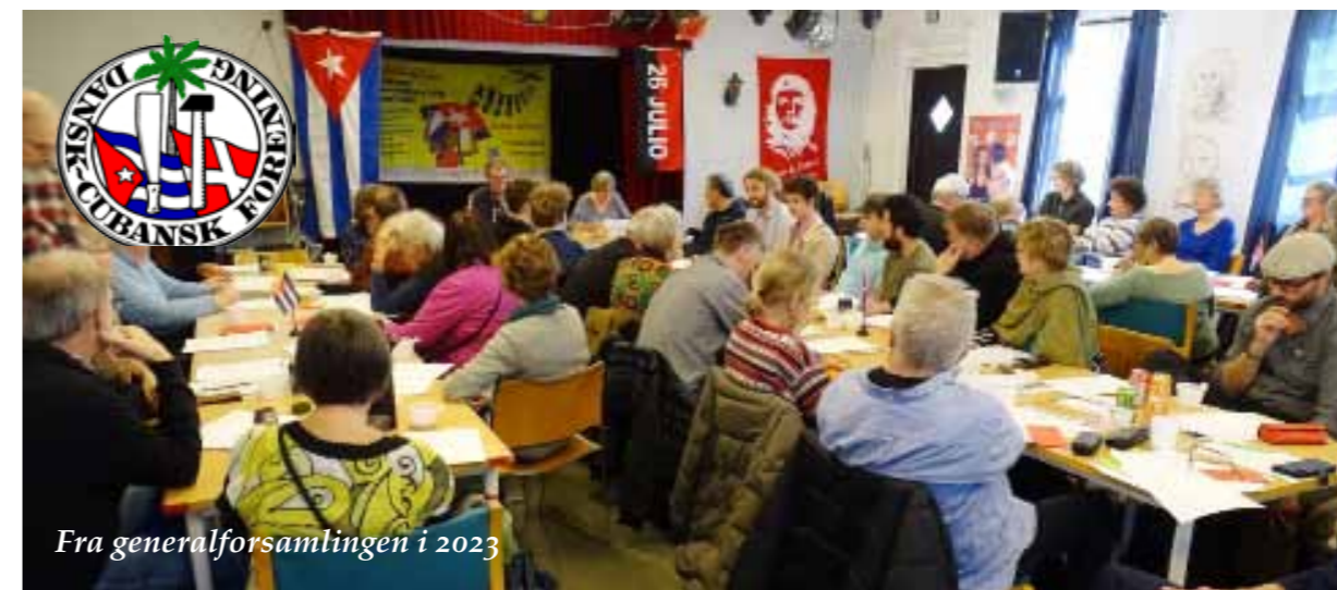
Fra generalforsamlingen i 2023

I henhold til vedtægterne skal forslag til behandling på generalforsamlingen samt kandidater til hovedbestyrelsen være foreningen i hænde senest 10 dage før generalforsamlingen – altså senest den 27. marts 2024.