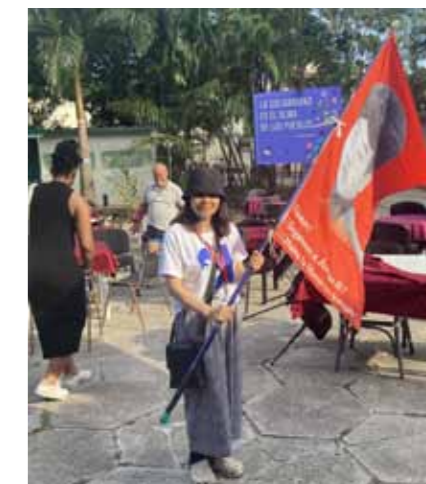
Det største kendskab til Cuba får man ved at besøge landet med en solidaritetsbrigade. Der var danskere med på 1. maj brigaden i 2023, hvor der deltog 300 brigadister fra 29 lande.

I forbindelse med 50-året for kuppet i Chile blev der afholdt en del arrangementer i Danmark, som Dansk Cubansk Forening bakkede op om: Et arrangement på den Røde Plads i København, hvor et vægmaleri af Salvador Allende, som tidligere var blevet malet over, var blevet restaureret, så det igen fremstod klart. Et arrangement i BJMF; et arrangement i Arbejdermuseet, et arrangement i biblioteket i Farum, et arrangement på Københavns Universitet og en udstilling på Universitet. Alt