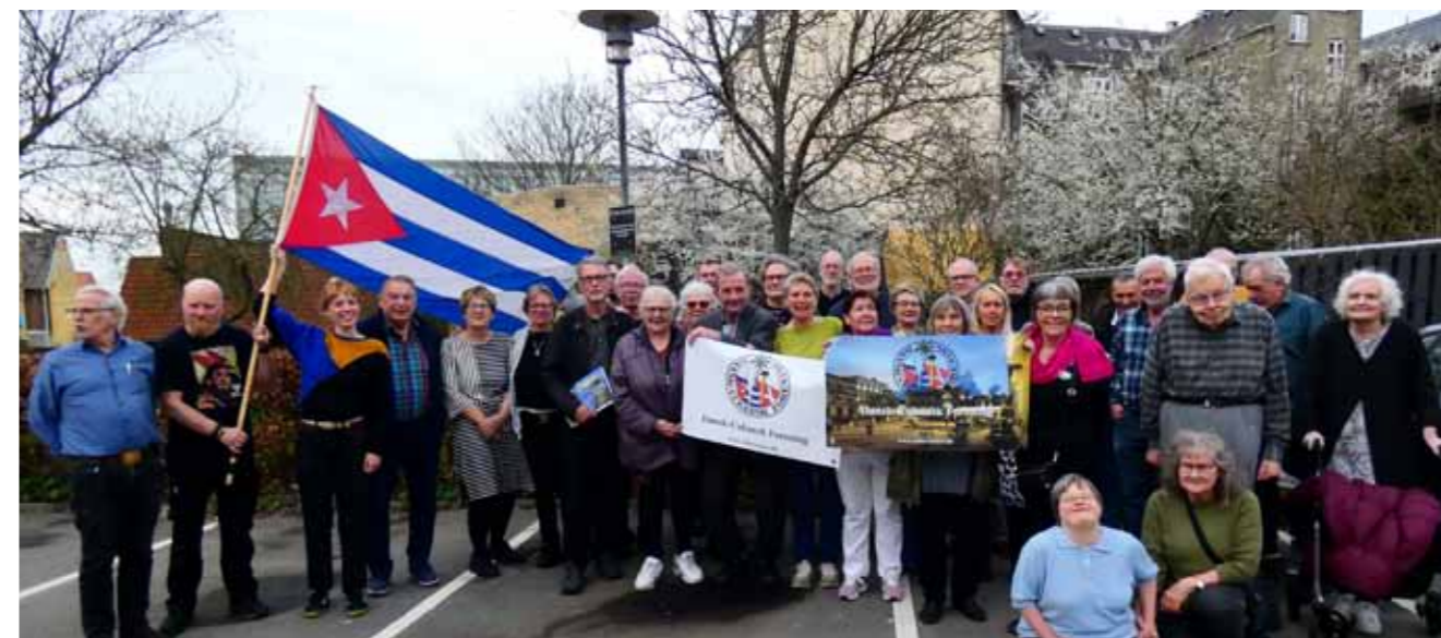
Der var et fint fremmøde af medlemmer. Solidariteten med Cuba er stærk.

Bestyrelsen blev opfordret til at stille forslag om ændring af vedtægterne, således at benævnelsen »revisor« erstattes af bilagskontrollant.