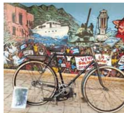
Klubben medbragte en cykel Che Guevara har kørt rundt på, og som en ven er i besiddelse af.