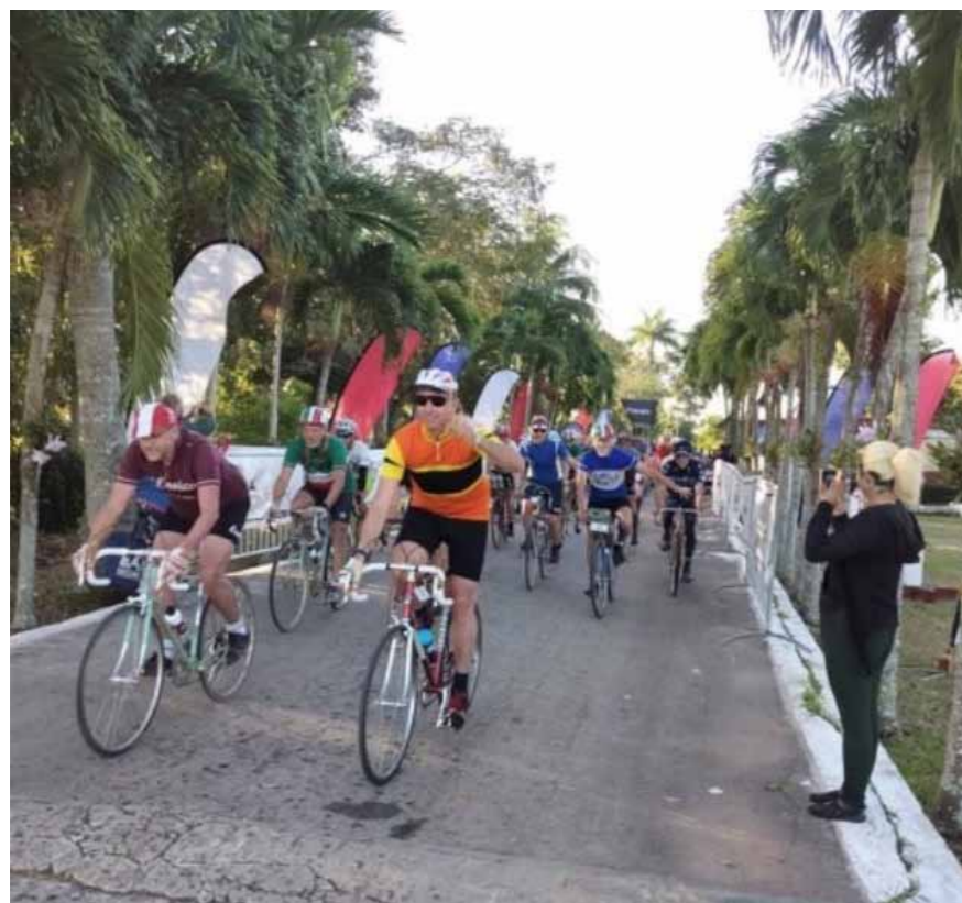
Lejrens faciliteter passer perfekt ind i Eroicas koncept med, at det en 'vintage-cykelklub', hvor man kører på klassiske konkurrencecykler, tøj og tilbehør fremstillet før 1986.

Med udgangspunkt fra Campamento International Julio Antonio Melle i Caimito, som normalt er vært for internationale brigader, delegationer og grupper for solidaritet med Cuba, kørte de