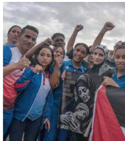
Cubas internationalisme og solidaritet med verdens folk er tydelige under demonstrationer mod folkemordet i Gaza.

Hun nævner som eksempel Cubas bioteknologiske industri, hvor den farmaceutiske sektor via import af råvarer normalt formår at producere 70% af den medicin, som det cubanske sundhedssystem har brug for. De sidste 30% importeredes fra andre lande, »men nu er den lokale produktion hårdt ramt af problemer med at importere råvarer,