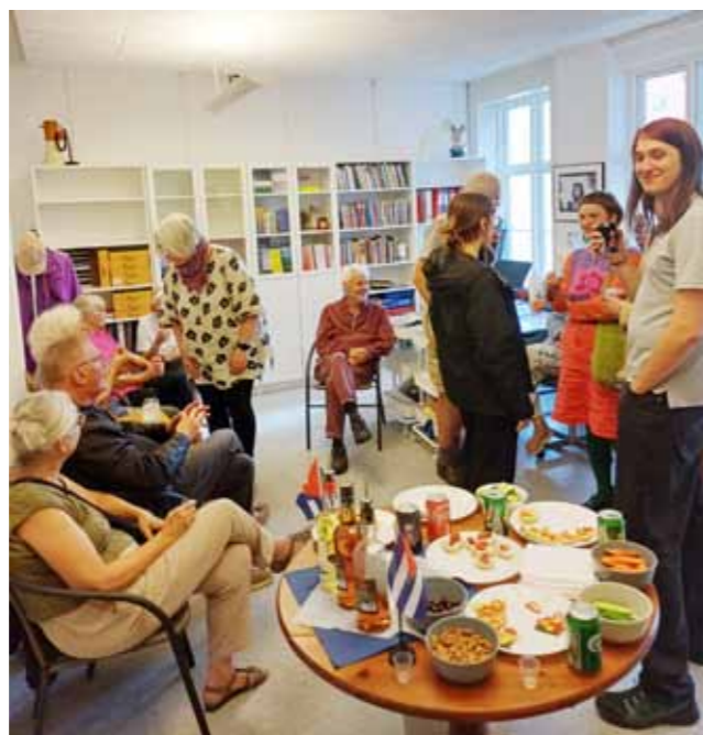
Efter 12 begivenhedsrige år i Valby Kulturcenter sammen med Casa Latinoamericana på Høffdingsvej 10 i Valby er Dansk-Cubansk Forenings landskontor nu flyttet. Ny adresse er Studiestræde 24,2 sal o.g. 1455 København K. Onsdag den 21. august var første dag på det nye kontor med besøg af medlemmer og nogle af naboerne, SUF, NOAH, DEO, Enhedslisten m.fl.